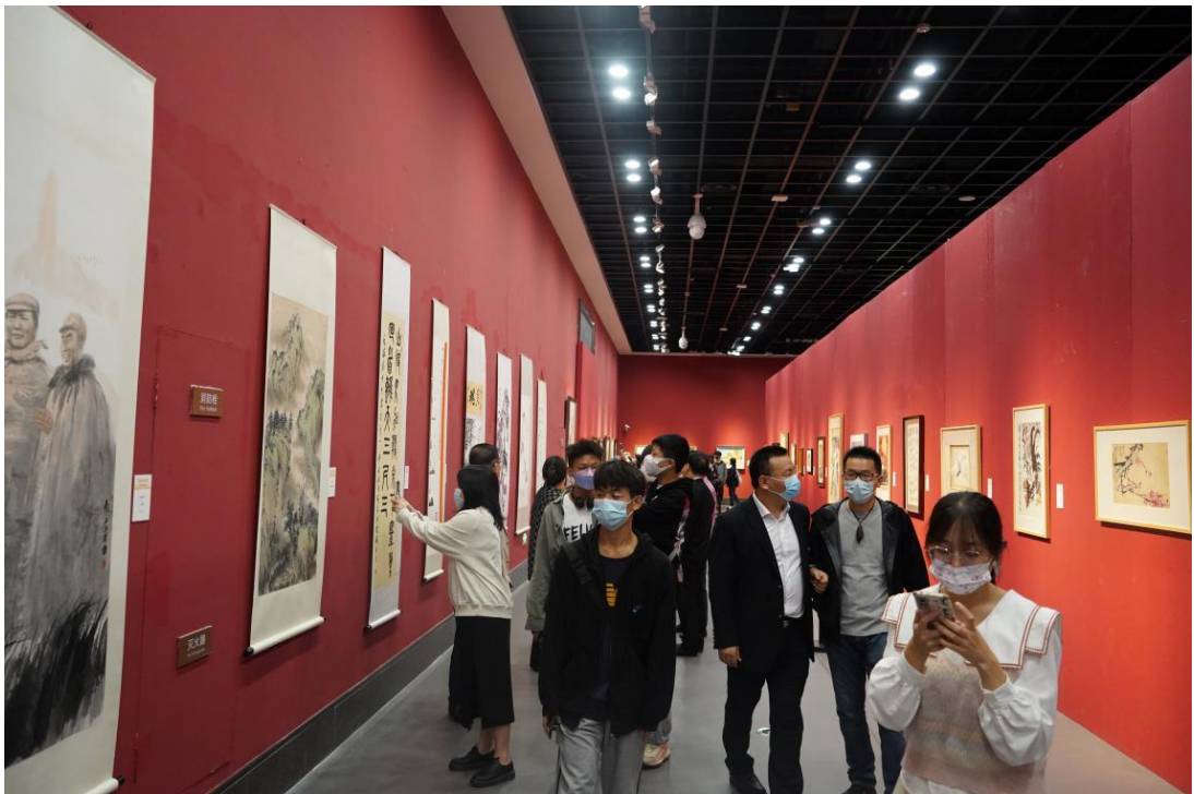
慕名前来参观书画展的群众