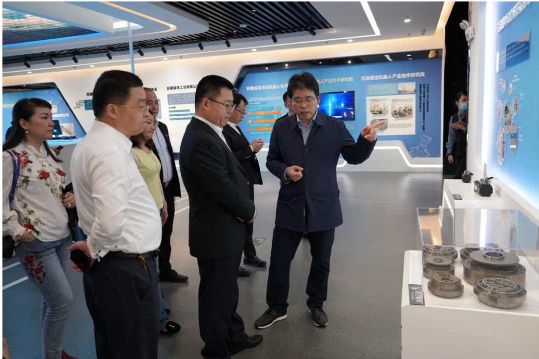
宁波市侨商会考察团参观芜湖市产业创新馆