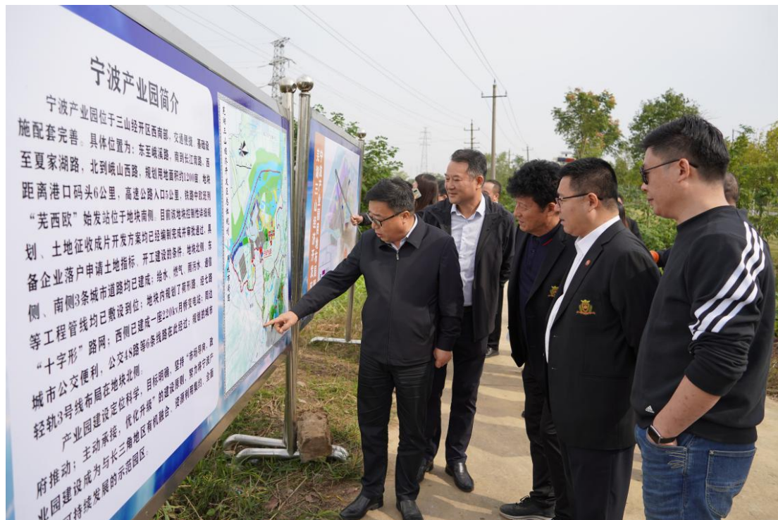
宁波市侨商会考察团参观三山经开区宁波产业园地块

据了解，三山经济开发区位于芜湖市域中心，作为芜湖经济发展的“主战场”和重要增长极，三山经济开发区始终